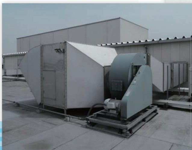
陽圧給気システム