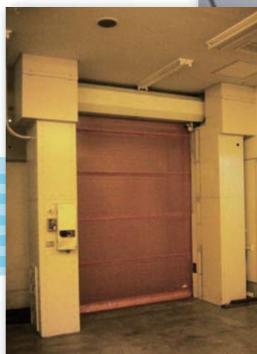
防虫エアカーテン