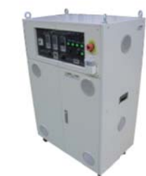
デフオイル温調装置 高温・低温(高粘度)1ポンプ仕様