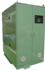
コールドスタート試験用ATF温調装置 ブラインレス直影方式の低コスト仕様