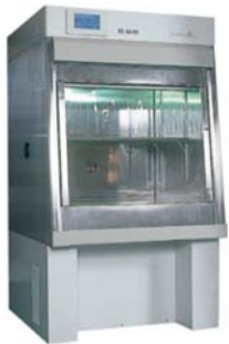
ドアレス恒温槽「ノードアα」