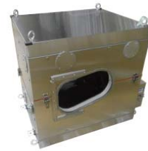
供試体用恒温槽 駆動部品温度 -50℃仕様