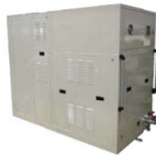
LLC-エンジンオイル温調装置 流量制御 多系統分流個別制御仕様